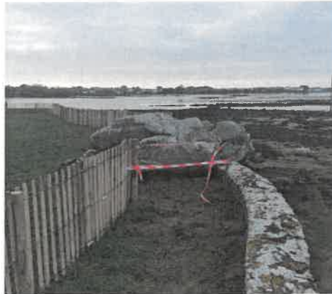
Situation avant modification

La parcelle AD 1 est grevée d'une servitude de droit en application de l'arrêté préfectoral du 29 octobre 1991 (l'arrêté préfectoral du 2 mars 2021 n'a pas modifié cette situation). La servitude est donc instituée dans la bande des trois mètres jouxtant la limite du domaine public maritime, celle-ci correspondant à la base extérieure du mur de la propriété. La mise en œuvre de cette servitude de droit se heurte à la présence d'un rocher dont le franchissement par les piétons n'est pas compatible avec la sécurité attendue du cheminement.