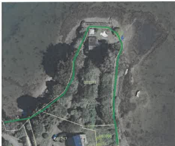
Tracé de la servitude avant modification

Lors des travaux de mise en œuvre de la servitude engagés en 2023, il s'est avéré que la continuité du cheminement sur l'espace public n'était pas possible à l'Ouest de la maison de la pointe en raison de la dégradation et de l'instabilité de la falaise.