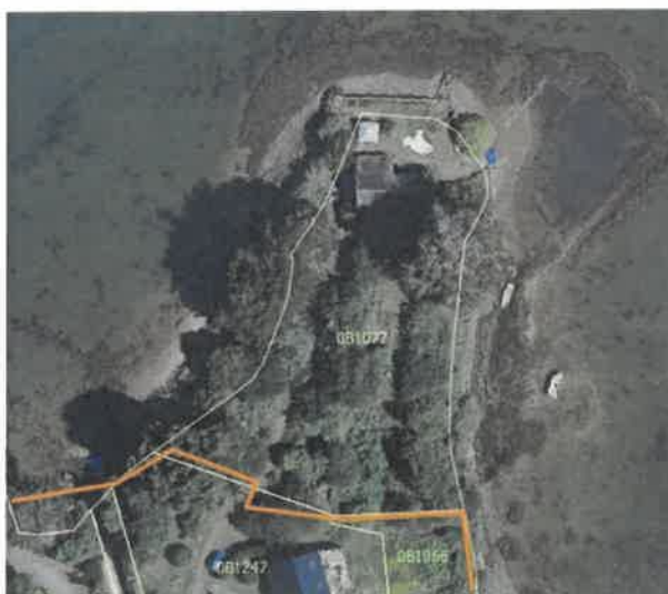
Tracé modifié de la servitude

Compte tenu du caractère précaire des conventions de passage, la modification consiste à attribuer à ce cheminement le statut de la servitude de passage des piétons le long du littoral (servitude modifiée).